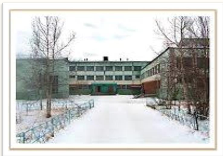
СОШ № 7 имени И. А. Кобеляцкого. 1989г.