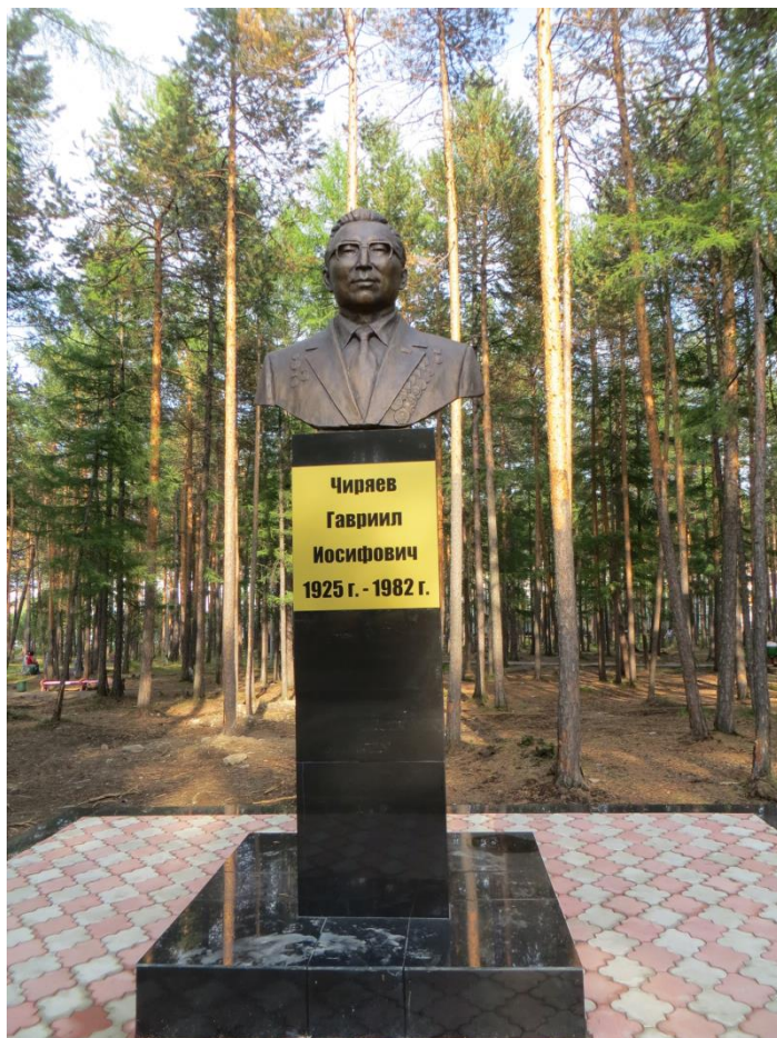
Памятник - Бюст Г. И. Чиряеву в парке отдыха Автор народный художник А. А. Романов