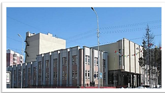
Центр Культуры и Духовности имени А. С. Пушкина

39. Отличный подарок городу и горожанам : Новый Дом культуры теперь – Центр культуры и духовности им. А. С. Пушкина // Индустрия Севера. – 1999. – 4 июня. – С. 3.