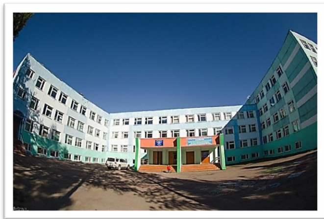
СОШ № 1 имени М. П. Кочнева