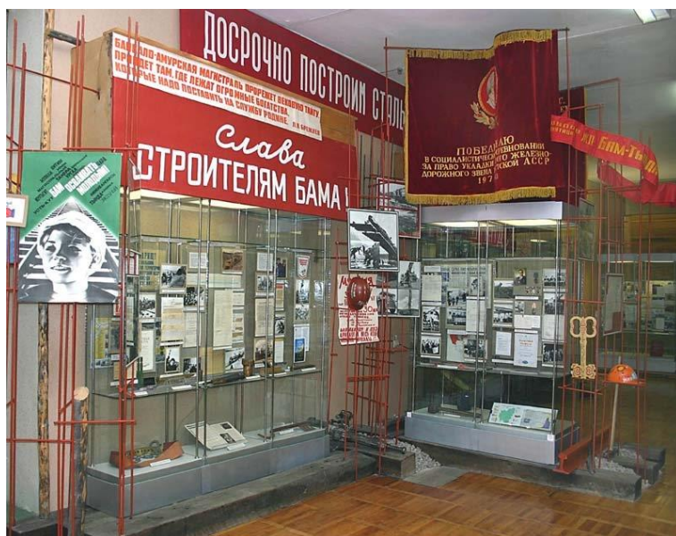
Музей истории освоения Южной Якутии им. И.И. Пьянкова