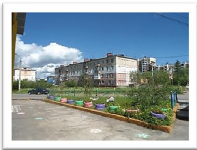
Улица имени Мусы Джалиля

71. Мустафин, Рафаэль Ахметович. Поэзия правды и страсти: [отрывок из вступ. ст. о М. Джалиле] / Р. А. Мустафин // Джалиль, Муса. Избранные произведения: [Стихотворения, поэмы] – Л.: Советский писатель, 1979. – С. 5 – 44. – (Библиотека поэта. Большая сер. 2-е изд.)