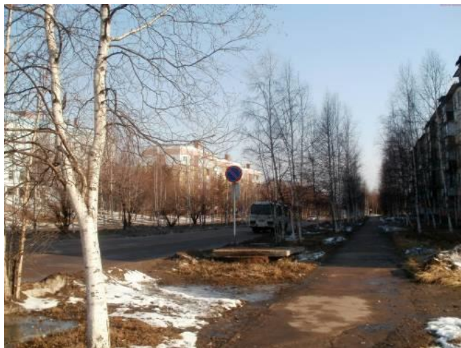
Улица имени П. Ойунского

Платон Алексеевич Ойунский (11 ноября 1893 – 31 октября 1939) – основоположник якутской советской литературы, поэт, прозаик, драматург, философ. В годы культа личности Сталина был необоснованно репрессирован и умер в тюрьме. Улица им. П. Ойунского протяженностью всего один квартал, такая же короткая, как и жизнь писателя.