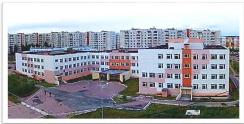
Информационно-технологический лицей № 24 г. Нерюнгри