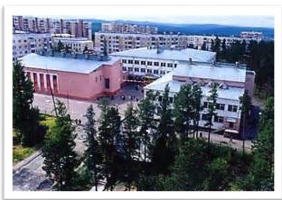
МОУ Гимназия №1 имени С. С. Каримовой