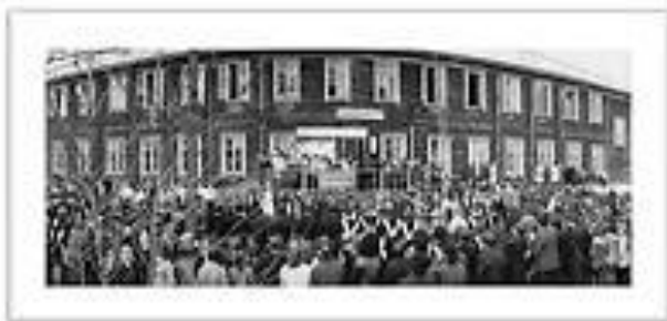
СОШ № 7. 1988г.

77. Игорю Александровичу Кобеляцкому: [стихотворение] : [Электронный ресурс] // http://www.aldanweb.ru : [сайт]. - .2012. - URL : http://www.aldanweb.ru/load/stikhi_geologov_tugreh/stikhi_maloizvestnykh_i_neizvestnykh_avtorov/igorju_aleksandrovichu_kobeljackomu_vas_ne_odurmanil_slavy_dym/75-1-0-367