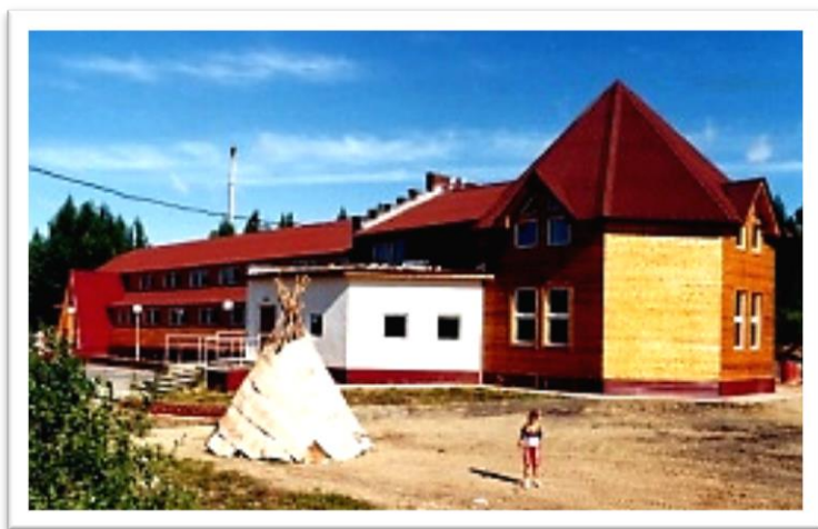
Этнокультурный центр "Эян" имени В. С. Еноховой